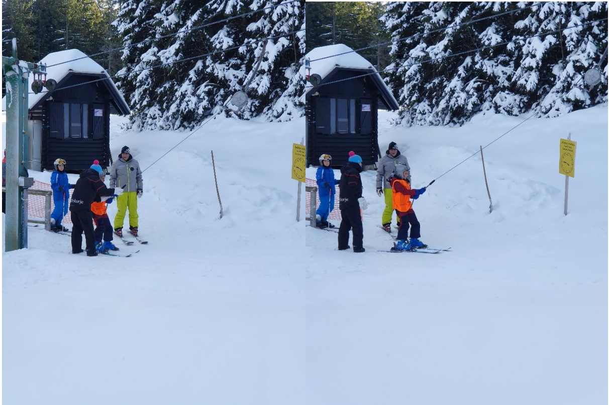
Večerne aktivnosti na snegu