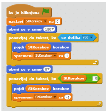
Slika 2: Gravitacija 5. razred