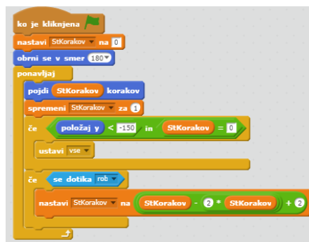
Slika 3: Gravitacija 6. razred